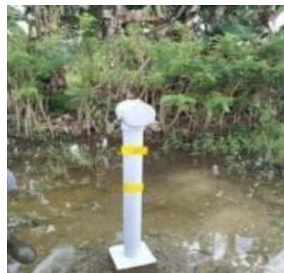
Gambar 1. Test Box Cathodic PT. X

Sistem pipa gas PT. Perta Daya Gas Unit Gas Pipeline Sorong berfungsi menyalurkan gas alam dari Metering and Regulating Station (MRS) menuju PLTMG MPP 50 MW Sorong dengan panjang pipa sekitar 10 km dan sebagian besar tertanam di bawah tanah. Kondisi ini menjadikan pipa sangat rentan terhadap korosi eksternal akibat kontak langsung dengan tanah sebagai media elektrolit. Oleh karena itu, penerapan sistem proteksi katodik menjadi bagian penting dalam menjaga integritas pipa.